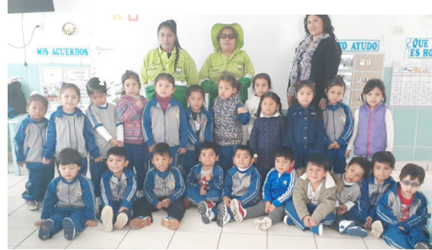
I.E. Mártir Olaya N° 010