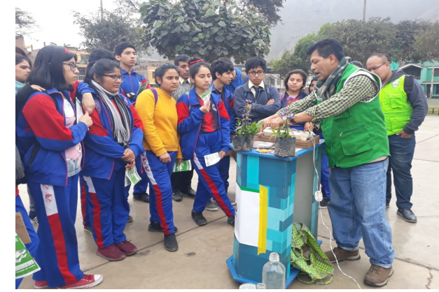
I.E. José Carlos Mariátegui