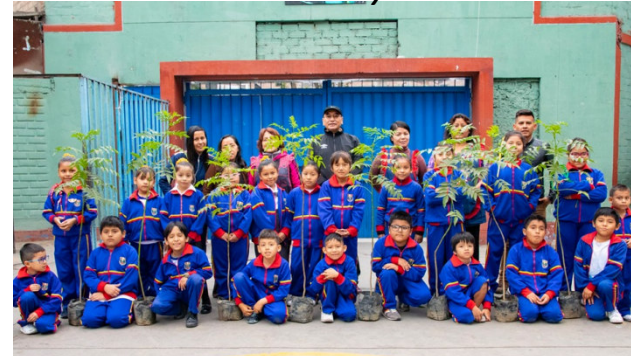
I.E. Glorioso Húsares de Junín