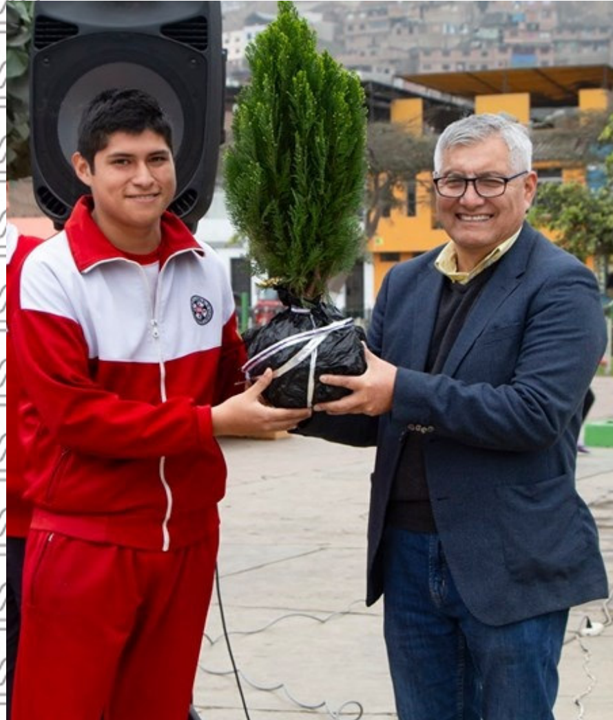
Colegio Fe y Alegría